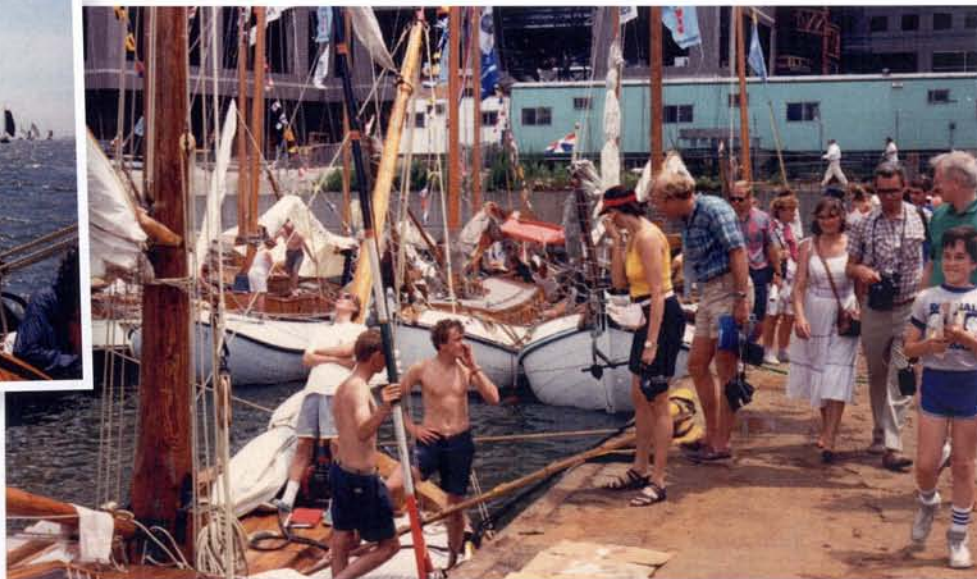
rechts: In New York bestond er veel belangstelling voor die vreemde Nederlandse schepen met die rare 'planken' opzij