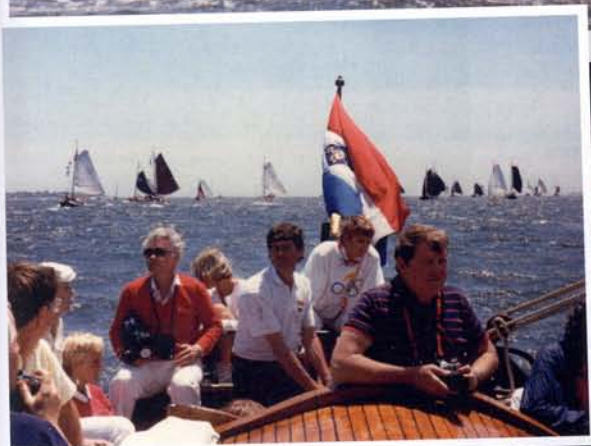
boven: Rond- en platbodems in frontlinie tijdens het admiraalzeilen bij New York