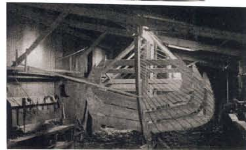
links: De Ouderhoek tijdens een Flevorace met Jan Romke de Vries aan het helmhout.